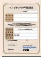
インプラント10年保証書

ガイドデント認定の歯科医師によってインプラントの治療が完了した時点で、患者様に「インプラント10年保証書」が発行されます。下記のような場合、保証書記載の保証限度額を上限に無償で再治療を受けることができます。